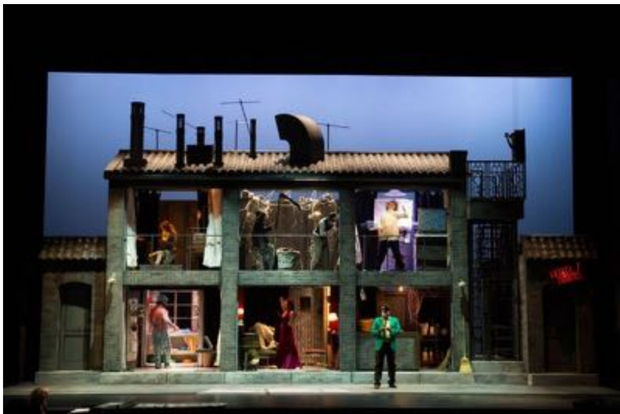
Wonderland produzione Teatro Stabile di Bolzano, regia di Daniele Ciprì (scenografia)