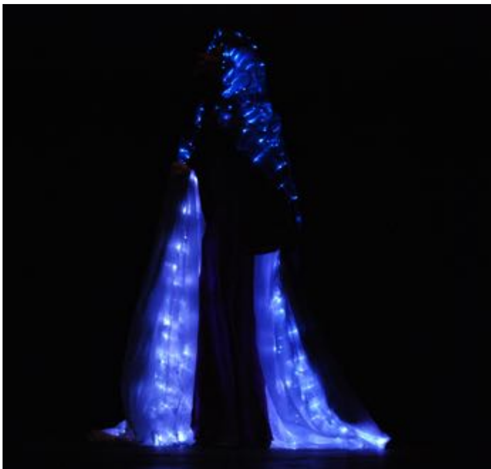
produzione Teatri Alchemici, regia di Ugo Giacomazzi e Luigi Di Gangi (scene e costumi)