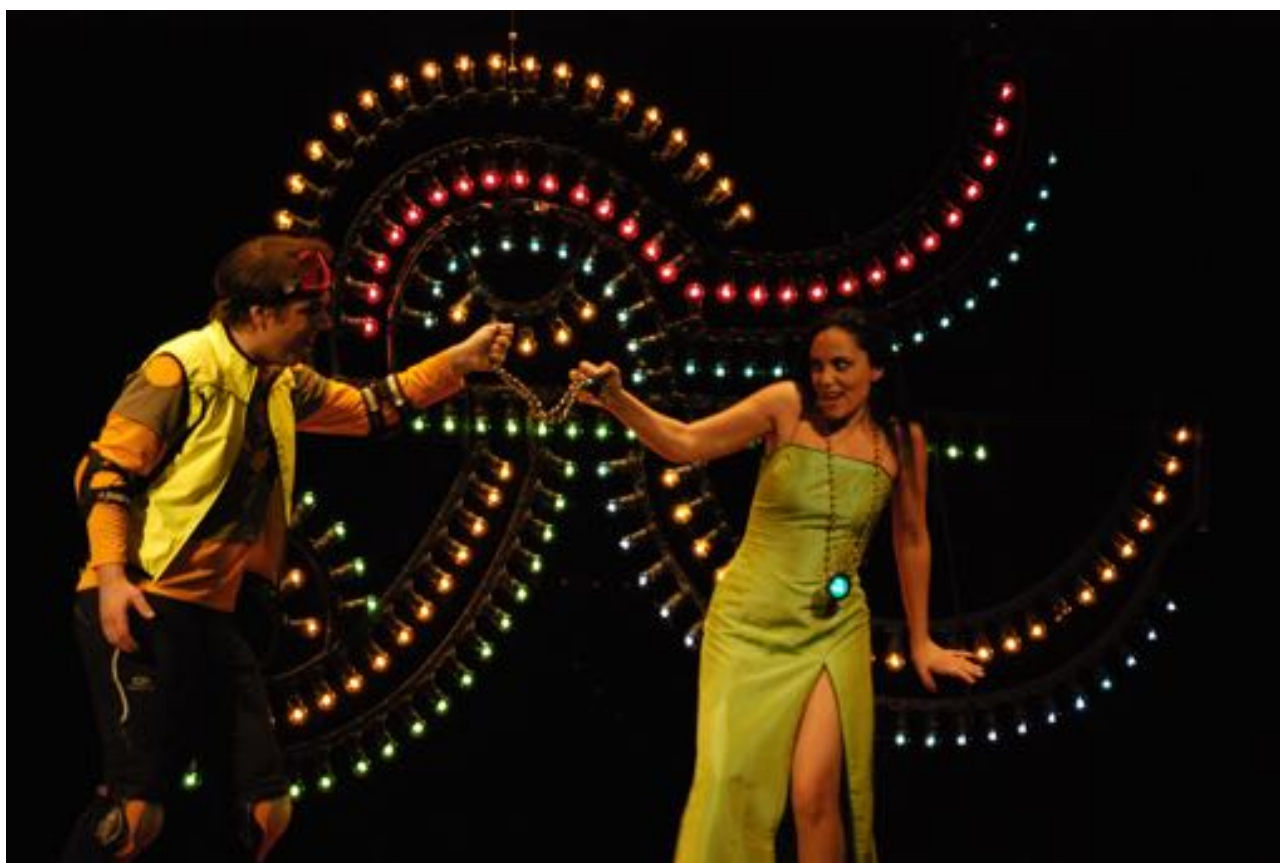
Così fan tutte di W.A. Mozart Théâtre de l'Opéra di Saint-Étienne 2009 (scene e costumi)