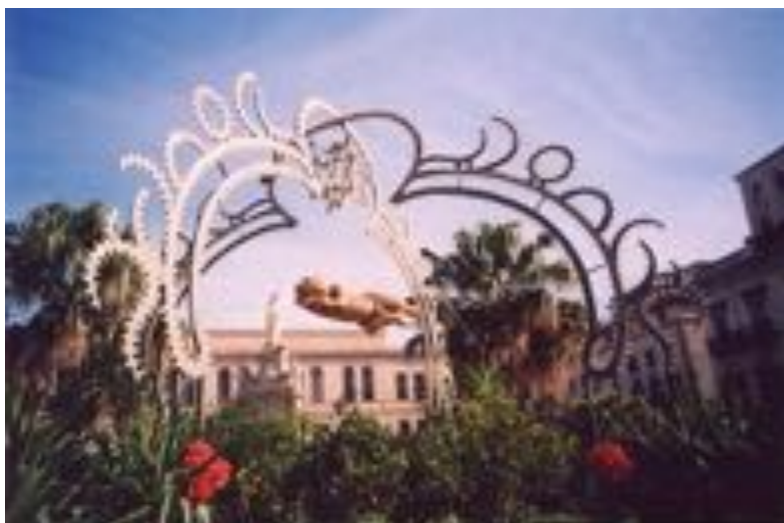
Installazione del "Bambinello" nel giardino della Cattedrale di Palermo. Natale 2002 (ideazione e cura della realizzazione)